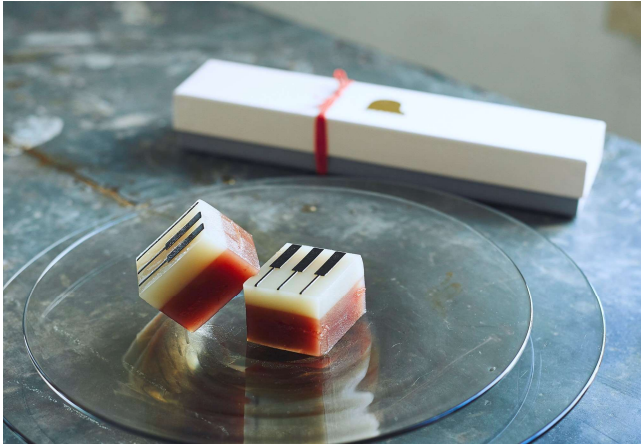
©12月限定 ジャズ羊羹 strawberry