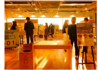
前回開催時(2021年)の様子