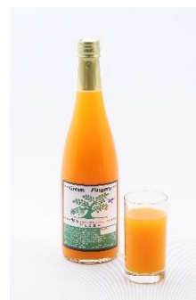
野々100%みかんジュース

1個が50g前後の中玉系の品種で、糖度が高く、果皮果肉共にしっかりしているフルーティーなトマトです。